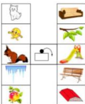
Предлоги «над», «с» («со»)