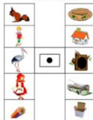
Предлоги «в», «из»